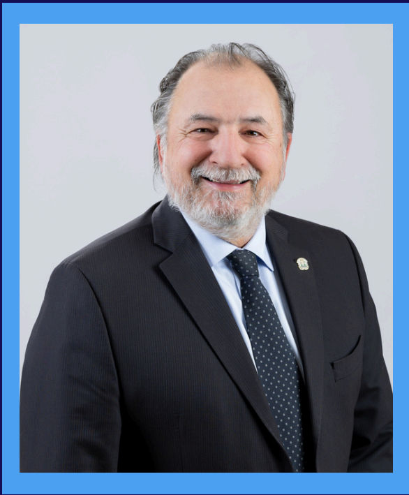
Gino Pouliot maire de Château-Richer

Conformément aux dispositions de la Loi sur les cités et villes, il me fait plaisir de vous présenter les faits saillants du rapport financier 2025, ainsi que le rapport du vérificateur externe.