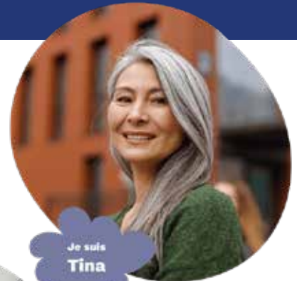
Je suis Tina

En parler. Repérer les signes. Agir. Plus tôt.