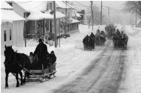
L'hiver à Saint-Séverin, un peu plus difficile qu'ailleurs parfois.

Les processions regroupaient non seulement les porteurs. Bien sûr, parents et amis accompagnaient les défunts. Parmi la délégation, on retrouvait aussi une personne, souvent un ami de la famille, qui transportait la croix de tempérance, et les autres officiants.