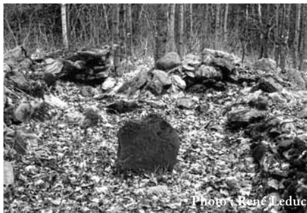
Les vestiges du cimetière anglican.

Pour nos visiteurs les plus audacieux, vous pouvez visiter ce site, en suivant le rang Sainte-Marguerite sur 6,5 kilomètres. Un sentier forestier sur la droite, identifié par des rubans de couleur sur les arbres qui bordent la route, vous conduira à ces vestiges où une plaque commémorative rappelle cette présence irlandaise à Saint-Séverin.