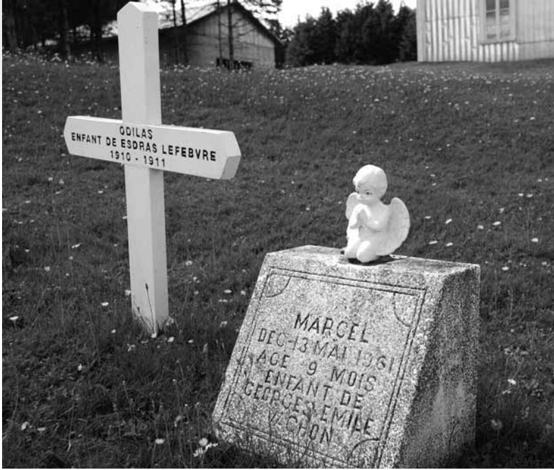
Monuments d'enfants dans le cimetière de Saint-Séverin.