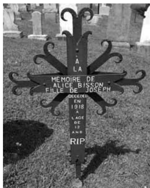
Détails de croix en fer forgé.

Essentiellement, les forgerons québécois ne réalisaient ce type d'ouvrage qu'au moment où on leur en passait la commande. On pouvait le faire par souci d'économie. En effet, tous n'avaient pas les moyens de se procurer un monument en pierre. Autre point : le métal aurait une durabilité supérieure au bois.