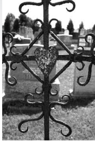
Les artisans locaux fabriquaient de belles croix artisanales.

Le cimetière de Saint-Séverin est souvent cité comme l'un de ceux qui recèle de belles croix en fer forgé. Chefs d'œuvre d'art populaire, ces monuments présentent des caractéristiques qu'on retrouve notamment à leurs extrémités. Ainsi, des formes de cœurs, d'ancres, de tenailles, de fleurs de lys, de pointes de lances les enjolivent. À Saint-Séverin, on peut remarquer quelques-uns de ces types d'ouvrage.