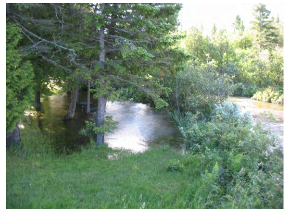
Lac des Trois-Milles, le 19 juin 2018