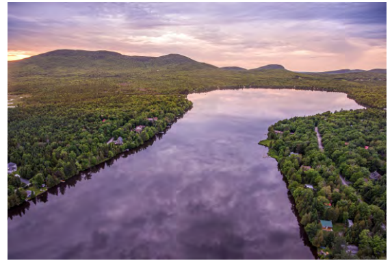
Vue aérienne du lac - Claude Grenier