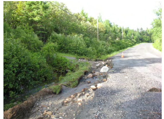
Rue Principale, le 19 juin 2018