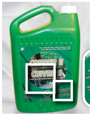
DOMESTIQUE - LIRE L'ÉTIQUETTE AVANT L'UTILISATION - GARANTIE : CUIVRE présent sous forme de naphthalène de cuivre 2 % - N° D'HOM. 10761 LOI SUR LES PA. GARDER HORS DE LA PORTÉE DES ENFANTS POUR USAGE À L'EXTÉRIEUR UNiquement NE PAS UTILISER DANS LES HABITATIONS 13-674 0411

Ces produits sont considérés comme des pesticides. Ils renferment des ingrédients actifs et sont réglementés en vertu de la Loi sur les produits antiparasitaires. Ils doivent donc être homologués et leur numéro d'homologation apparaît obligatoirement sur l'étiquette.