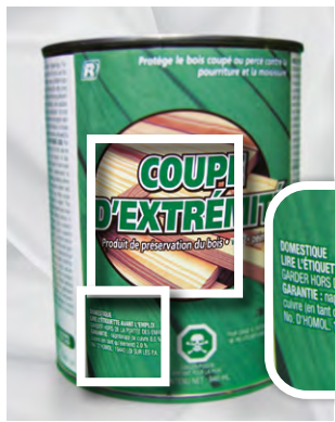
DOMESTIQUE LIRE L'ÉTIQUETTE AVANT L'EMPLOI GARDER HORS DE LA PORTÉE DES ENFANTS GARANTIE : naphthalène de cuivre 0,0 % Cuivre (en tant qu'élément) 2,0 % No. 19 HOMOL. 19440 LOI SUR LES PA.