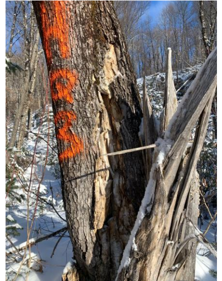
Un arbre à risque identifié en prévision des travaux d'abattage.

Coupe des arbres ou des branches fragiles ou vulnérables susceptibles de tomber sur les fils électriques.