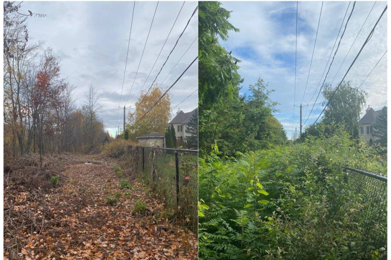
La disposition des résidus en andains avant et après sur une période de un an.

Tout autre arbre : les résidus sont laissés sur place sur le sol ou entassés en petits monticules appelés andains.