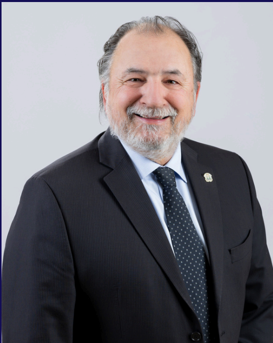
Gino Pouliot maire de Château-Richer

Conformément aux dispositions de la Loi sur les cités et villes, il me fait plaisir de vous présenter les faits saillants du rapport financier 2025, ainsi que le rapport du vérificateur externe.