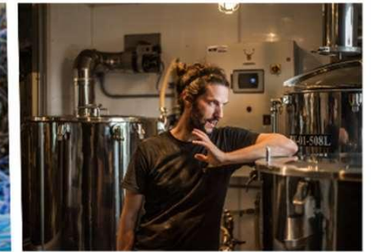
Microbrasserie de Bellechasse

2 des 7 entreprises ambassadrices de Synergie Bellechasse-Etchemins