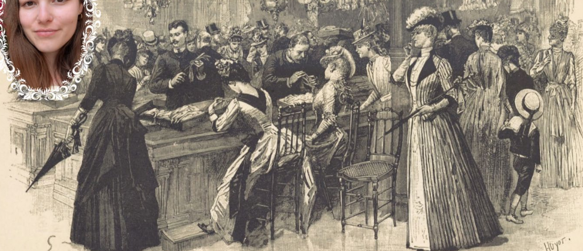
Flaviën, E.(18..) Les magasins du Bon Marché, fondés par Aristide Boucicaut à Paris. Paris - Quantin, page 31.