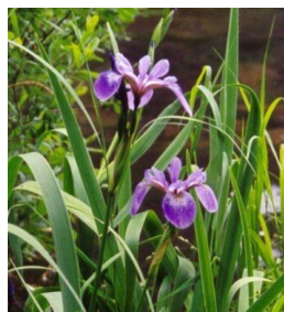
Iris versicolor (fleur emblématique du Québec)

Nous désirons remercier toutes les personnes qui se sont procuré des fleurs et des arbustes lors de la vente de cet été. Comme vous le savez, ces arbres et ces plantes ont un bienfait