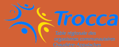
Table régionale des organismes communautaires de Chaudière-Appalaches