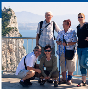
Faire un voyage organisé