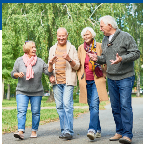
Joindre un groupe de marche