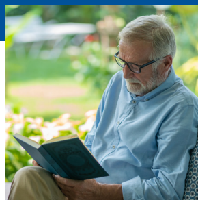
Joindre un groupe de lecture