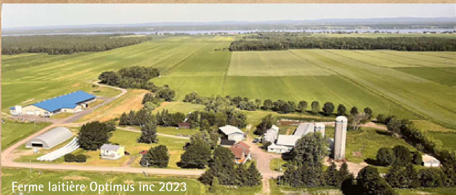
Ferme laitière Optimus inc 2023

La production laitière, acéricole et les grandes cultures certifiées biologiques sont les principales productions de la ferme.