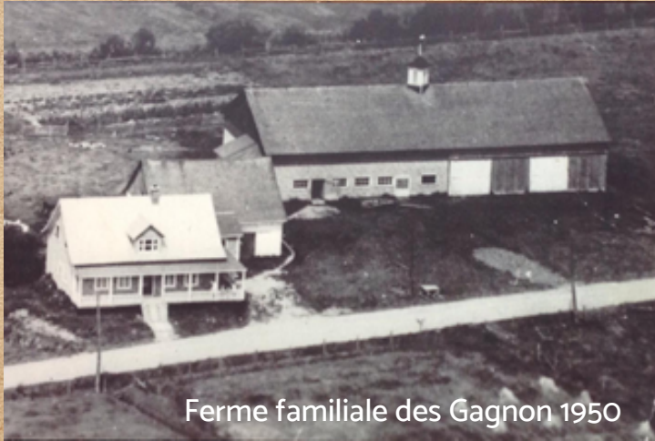
Ferme familiale des Gagnon 1950