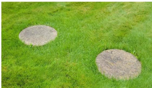
Couvercles non dégagés

basculer les couvercles sans difficulté et sans les briser. Les couvercles de fosses en polyéthylène doivent être dévissés, mais non enlevés ;