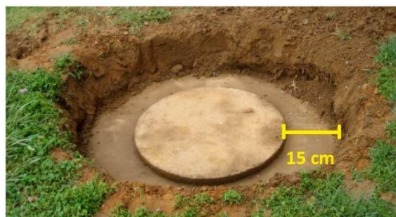
Couvercle bien dégagé