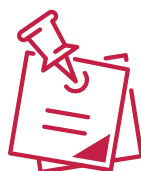
TABLEAU DE SEUIL DE FAIBLE REVENU SELON STATISTIQUES CANADA

Ressources familiales Côte-de-Beaupré (C8-20, rue de Fatima Est, Beaupré ) est l'intermédiaire pour l'inscription à ces activités de loisir. Pour plus d'informations : 418 827-4625.