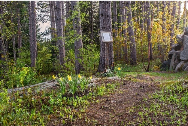
Le Sous-bois poétique