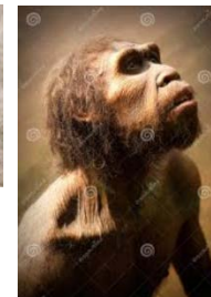
Homme des cavernes